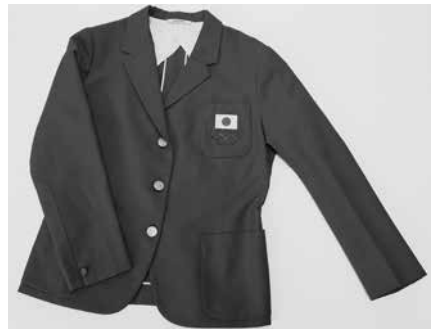
デレガーションユニフォーム（小野喬） 1964年 秩父宮記念スポーツ博物館蔵

メインスタジアムの国立競技場をはじめとして、各施設の建設・整備によって東京の風景が一変するとともに、オリンピックへの期待は、国民の生活に大きな変化をもたらしました。