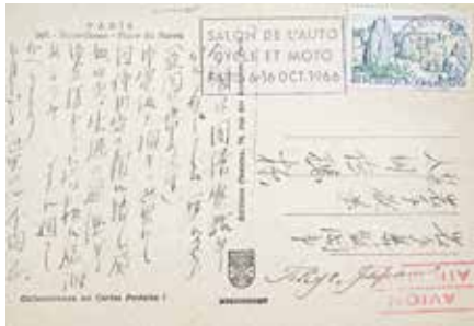
千田正書簡（盛岡てがみ館蔵）

第25回国民体育大会（みちのく国体）の岩手県での開催は昭和41年7月に内定し、翌年に正式決定しました。国体誘致の歴史は昭和30年代前半にさかのぼ