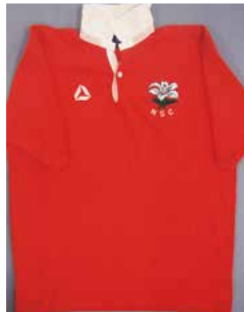
新日鐵釜石ジャージ （釜石シーウェイブスRFC蔵）

新日鐵釜石ラグビー部は、昭和34年（1959）に、前身の富士製鉄釜石製鉄所のラグビー部として発足しました。昭和45年（1970）に富士製鉄と八幡製鉄が合併して新日本製鉄へ社名変更すると、チーム名も「新日鐵釜石」となりました。同年に全国社会人大会で初優勝を果たし、昭和51年（1976）に全国社会人大会で2度目、日本選手権で初優勝