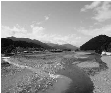
南部橋上からみる富士川・戸栗川合流点と、その北に広がる南部氏発祥の地