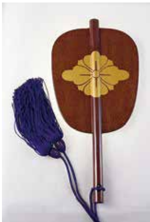
第27代木村庄之助軍配 （公益財団法人日本相撲協会相撲博物館蔵）

大相撲の立行司第27代木村庄之助（本名：熊谷宗吉1925年ー）は昭和10年（1935）夏に、大相撲の巡業で盛岡滞在中の8代木村庄三郎（のちの19代式守伊之助）に勧められて、弟子入りしま