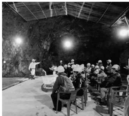
グラニットホール

さらに坑口から約0.8km地点までもどり、グラニットホール(音響実験室)で、デモテープによる立体的な音の響きを体感しました。