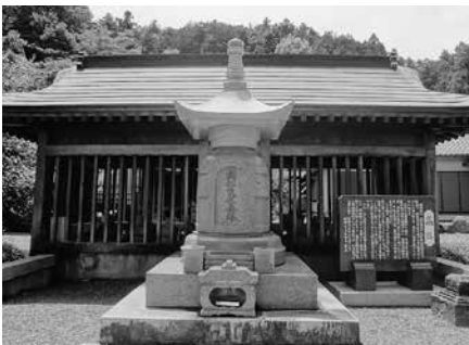
浄光寺境内の南部氏供養塔 背後の小屋の中に歴代の墓石がおさめられています

この墓石群の存在から考えると、鎌倉から南北朝時代にかけて、当主自身かどうかは別としても南部氏一族のいずれかの人物が、終始または断続的にこの地に居住していたことが推測されます。