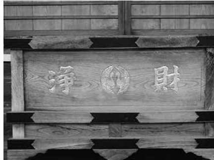
妙浄寺の寶銭箱 根城南部氏と同じ向鶴紋が寺紋として採用されています