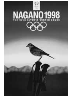
長野オリンピック 公式ポスター（第1号） 1994年 秩父宮記念スポーツ 博物館蔵

第18回冬季長野オリンピックは、1998年2月7日から22日まで行われました。日本はノルディックスキージャンプ団体で金メダルを獲得したほか、冬季オリンピック史上過去最高の成績を残しました。